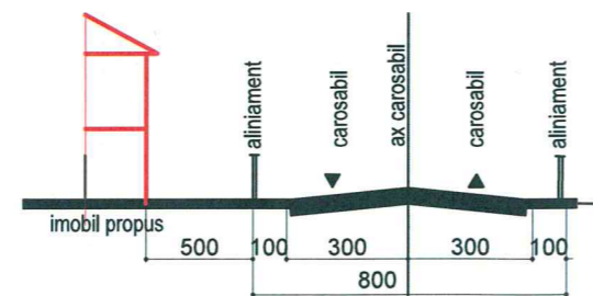
PROFIL STRADA CUPIDON

CONFORM CERTIFICATULUI DE URBANISM NR. 1010-C DIN 12 06 2019 PARCAREA SI GARAREA SE VOR REALIZA IN INCINTA CU RESPECTAREA PREVEDERILOR H.C.G.M.B. NR. 66 / 2006